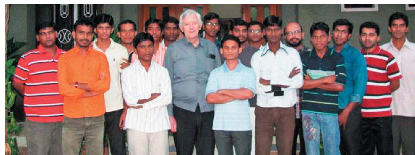
Il Padre Generale in India

4-9 Gennaio: La nuova Provincia Indiana ha tenuto la sua prima Congregazione Provinciale ed i cui decreti sono poi stati approvati dal Padre Generale il 20 marzo 2010.